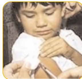
En niños con enfermedades cardíacas, renales y con disminución de las defensas inmunológicas consultar la aplicación de la vacuna antigripal (tanto en ellos como en sus familiares)