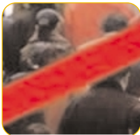
No ir con niños menores, durante los meses de invierno, a lugares donde asista mucha gente (supermercados, cines etc.) para así poder evitar contagios.