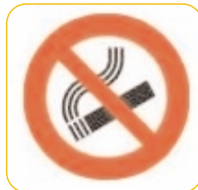
Que no haya humo de cigarrillo u otro origen en el ambiente del niño.