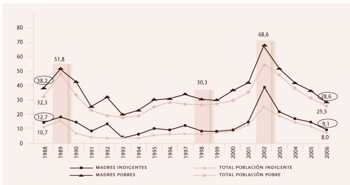
Gráfico 1: Comparación de la evolución de la pobreza e indigencia en la población total (GBA) y entre las madres (total aglomerados urbanos). Período 1988-2006.

Fuente: Madres en la Argentina ¿Qué cambió en el umbral del Bicentenario? . Anuario de la Maternidad 2009. Observatorio de la Maternidad. Elaboración propia sobre la base de datos de la EPH 1988-2006.