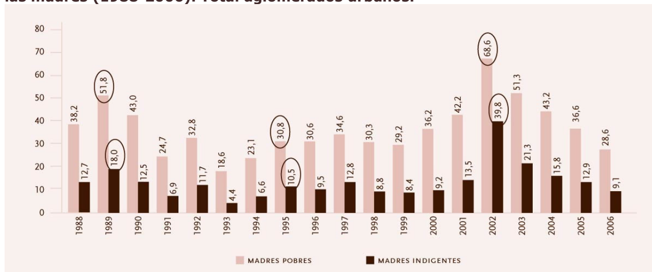
Gráfico 3: Impacto de las crisis económicas en los niveles de pobreza e indigencia de las madres (1988-2006). Total aglomerados urbanos.

Fuente: Madres en la Argentina ¿Qué cambió en el umbral del Bicentenario? . Anuario de la Maternidad 2009. Observatorio de la Maternidad. Elaboración propia sobre la base de datos de la EPH 1988-2006. Notas: * Para el período 1988-2002 corresponde la EPH puntual onda octubre, y para el período 2003-2006 corresponde la EPH continua 2º semestre. INDEC